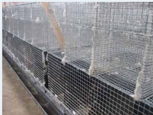
Reziduurile din cuștile de nurci se îndepărtează cel mai bine dacă se folosește un jet turbo.

La final, spălați tavanul și tâmplăria pentru a îndepărta murdăria umedă și fărâmicioasă.